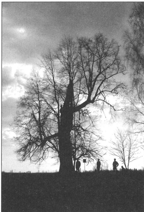
1. att. Strautmaļu Zviedru liepa

paaudzēs pat vēl 20. gs. sākumā liepa bijusi šīs dzimtas svētvieta, “šeit nākuši kā uz baznīcu” (D. Pēterēna). Ap liepas stumbru puslokā bijis salikts nelielu akmeņu krāvums, kurā atstāti ziedojuši gariņiem. Zīmīgi arī, ka teicējas vecvecāki pēc kāzām Ērgemes baznīcā noturējuši svētbriņķus arī pie liepas.