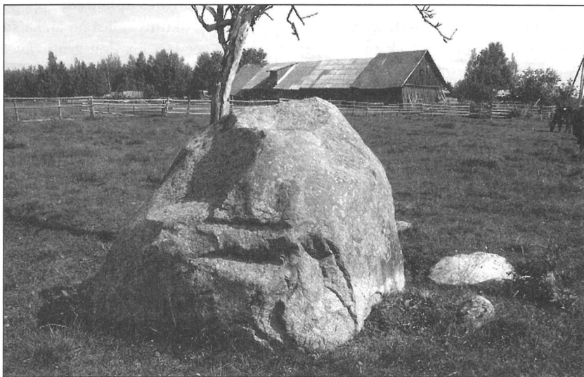
3. att. Dišleru Velna sēdeklis

Daudz izteiksmīgāks “Velna krēsla” akmens atrodas ganībās netālu no Dišleru kūts. Šo akmeni atrast palīdzēja Edgara Sproģa izstāstītā teika par Velnu, kas maisos pārnesis savu zeltu. Skrējis vairākas reizes un atpūšoties sēdējis uz akmens pie Dišlieriem, no kā iesēdējis akmeni iedobi. Velnam skrienot pēdējo