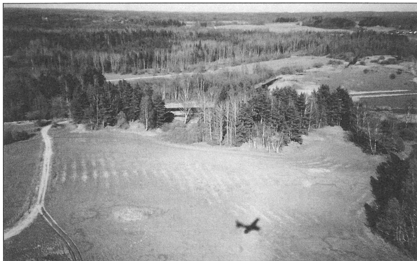
1. att. Cibēnu Cepures kalns (pa kreisi) un Elkus kalns (pa labi) skatā no putna lidojuma. Fig. 1. Cibēni Cepures ( Hat ) hill on the left and Elkus ( Idolatory ) hill on the right.

2001. gada 3. maijā tika veikta Slagūnes Cibēnu Cepures kalna aerālā apsekošana un fiksēšana (1. att.). 1 Vēlāk, izskatot iegūtos attēlus, tika ievērots, ka tīrumā uz rietumiem no Cibēnu Cepures kalna ir vairākas koncentriskas sulīgākas nokrāsas zāles parādītas zīmes, kuras pēc izmēriem apmēram atbilst agrā dzelzs laikmeta senkapu uzkalniņiem (1. att.). Lai mēģinātu atributēt šīs zīmes, tika veikta Cibēnu Cepures kalna un tā apkārtnes senvietu izpēte gan arhīvos, gan bibliotēkās, gan apsekojot šos objektus uz vietas. Rezultāti izrādījās savādāki, nekā tas iepriekš tika sagaidīts, kad likās, ka no gaisa ir atklātas jaunas, iepriekš nezināmas arheoloģiskās reālijas.