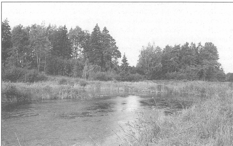
3. att. Cibēnu Elkus kalns (pa kreisi), Cepures kalns (pa labi) un aizaugušais Balziena ezers (priekšplānā).

Cibēnu mājas mūsdienās vairs nepastāv. Tās atradušās līdzās Cepures kalnam, kas tagad apaudzis kokiem (1.,3. att.). Virs aizaugošā Balziena ezera līmeņa kalns izceļas par astoņiem metriem, virs tuvākās apkārtnes ziemeļos un rietumos – par sešiem metriem. Visās pusēs kalna nogāzes ir stāvas; vistāvākais kalns ir pret dienvidaustrumiem. Kalna nedaudz kumpā, bet tomēr izlīdzinātā virsma, kuru varētu saukt arī par plakumu, ir nedaudz iegarena ziemeļrietumu dienvidaustrumu virzienā. Plakuma malās ir vairākas II Pasaules kara laika tranšejas un citi rakumi. Kalna pakājē ir vairākas no lauka novākto akmeņu kaudzes. Ziemeļrietumu nogāzē par vairākiem metriem ierakta lielāka bedre, šķiet, aizsākums grants ņemšanai. Līdzās