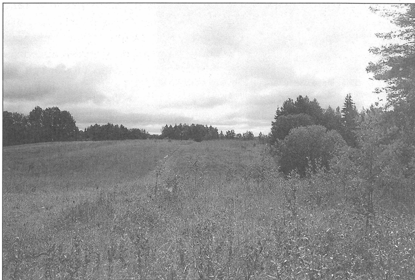
4. att. Cibēnu Mantas kalniņš. Fig. 4. Cibēni Mantas hill.

Pēc J. Dēringa un A. Bilenšteina plašajiem aprakstiem atsauces uz Cibēnu apkārtnes senvietām laiku pa laikam parādījās dažādās publikācijās. 21 1930. gadā Kārlis Dambis no Īles Vālodzēm nodeva Pieminekļu valdei pirms apmēram 40 gadiem Ozolkalnā atrasto masīvu bronzas kaklariņķi ar taurveida galiem, kas tika atspoguļots H. Mooras publikācijā. 22 Cibēnu Elkus kalns (6. att.) tika iekļauts E. Kurces Latvijas seno kulta vietu reģistrā. 23 Vietvārdu vākumā no Annenieku pagasta bez tuvākas lokalizācijas parādījās nosaukumi " elkus purvs " un " elkus kalns ". 24 Tā kā cita kalna vai purva ar šādu nosaukumu Anneniekos nav, varētu pieļaut, bet ne pierādīt, ka ar nosaukumu " elkus purvs " apzīmēts kāds purvs tiešā Elkus kalna tuvumā. Atzīmēsim, ka līdzīga situācija ir saistībā ar netālo Zebrenes Elku kalnu. Arī Zebrenē vietvārdu vākums uzrāda " elku purvu ", kas nav lokalizēts, bet līdzās Zebrenes Elku kalnam ir purvs. 25