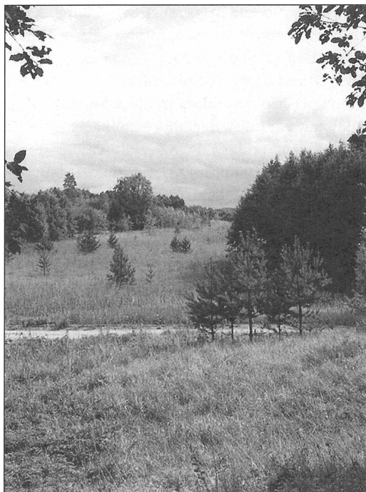
5. att. Sedliene starp Ozolkalnu un kāpveida ezera krastu – arheoloģiski pētītā senkapu uzkalniņa vieta.

Fig. 5. Anticline between Ozolkalns hill and the dune-like coast of the lake – archaeologically excavated tumulus burial field.