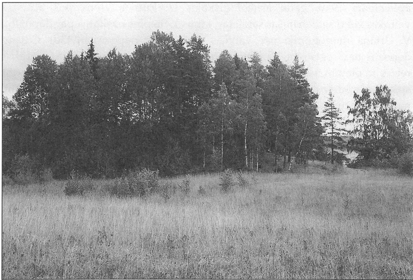
6. att. Cibēnu Elkus kalns.